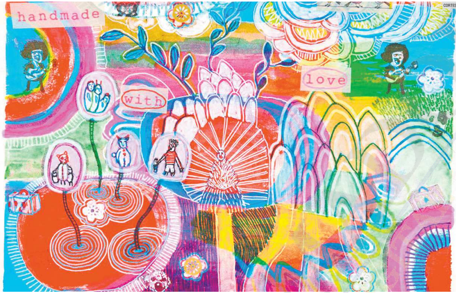
ARTE. Pieza de la exposición titulada "El nacimiento de los inclusivos".