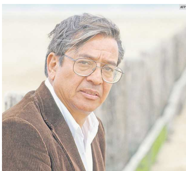
JOSÉ AGUSTÍN. El escritor fue reconocido con el Premio Latinoamericano de Narrativa Colima por "Ciudades desiertas".

FIL GUADALAJARA RENDIRÁN HOMENAJE A JOSÉ AGUSTÍN