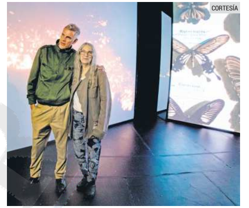
CONJUNTO SANTANDER. Patti Smith y Soundwalk Collective presentan "Correspondences", en la Sala 3 del Conjunto Santander.

Visita los museos y las galerías de la ciudad